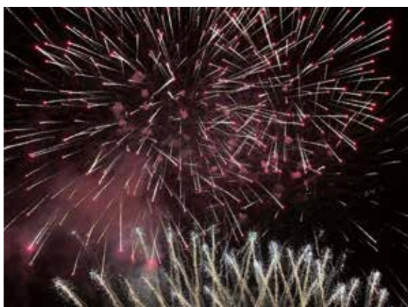
25 agosto Festa grande con i fuochi d'artificio il venerdì, scommessa vinta