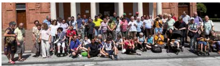
25 giugno Il Gruppo Fede e Luce di Cuneo