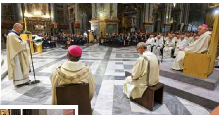
8 maggio In Cattedrale il Nunzio Apostolico in Italia Mons. Paul Emil Tscherrig presiede la Messa per l'unificazione di Cuneo-Fossano