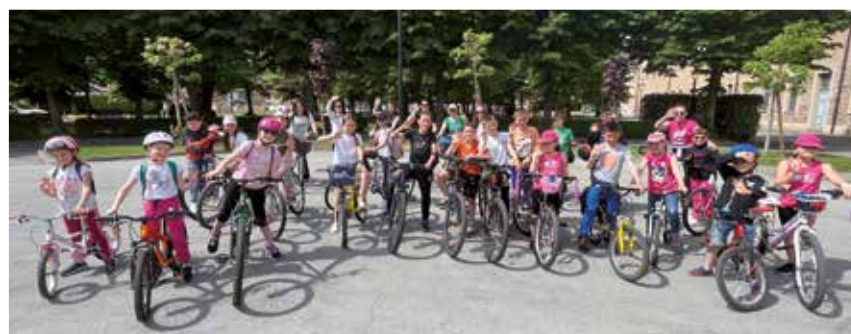
28 aprile I nostri ragazzi in partenza per concludere il catechismo a Santa Maria di Genola