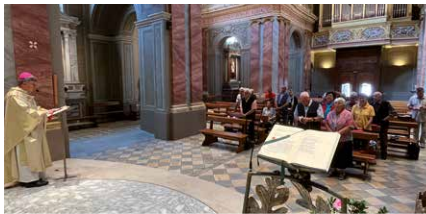
16 giugno Il gruppo Volontari di Villa Lascaris di Pianezza (TO), accolti dal nostro vescovo