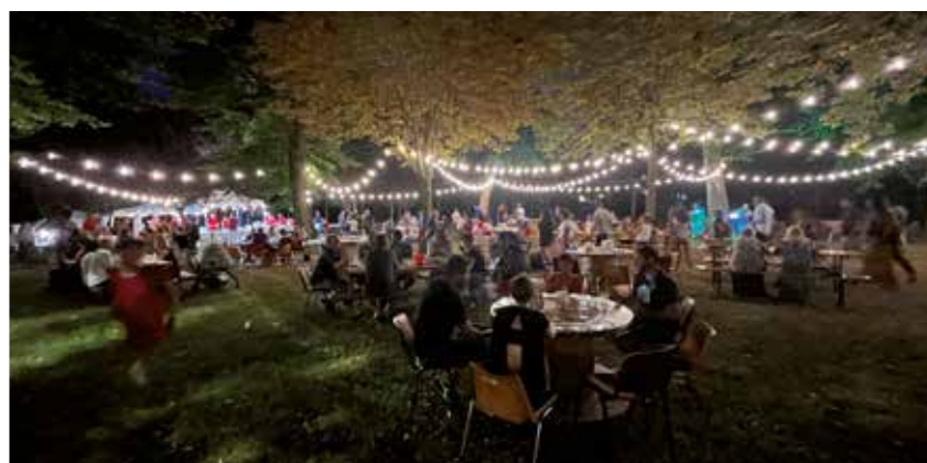
26 agosto Apericena sotto le stelle nel parco, molto suggestivo e originale