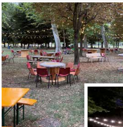
26 agosto Ecco tutto pronto per l'apericena... una novità