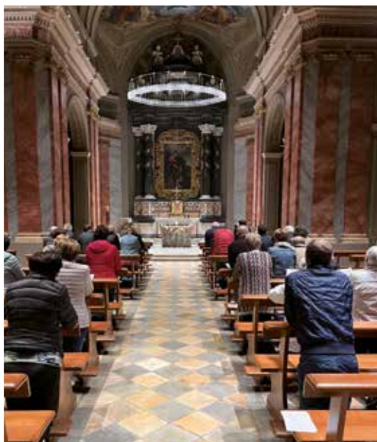
11 maggio L'adorazione Eucaristica delle zone della diocesi di Fossano