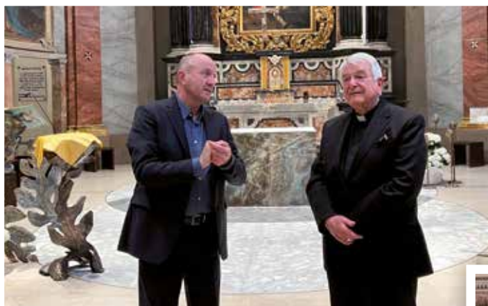
9 maggio Il Nunzio Apostolico in visita al Santuario. Il Papa il 30 Settembre scorso lo ha creato Cardinale