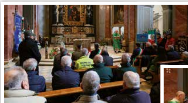
4 febbraio Commemorazione degli Alpini caduti in Russia