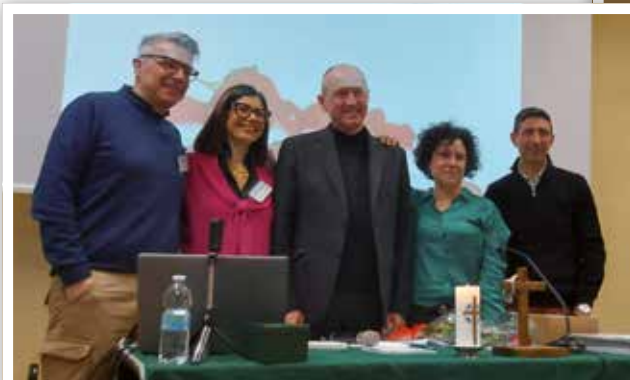
4 febbraio La benedizione della coppia dei vicecoordinatori per Retrouvaille Italia Nord-Ovest