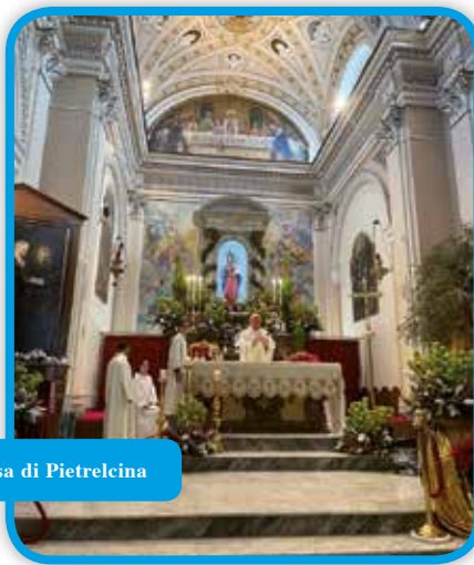
Nella chiesa di Pietrelcina