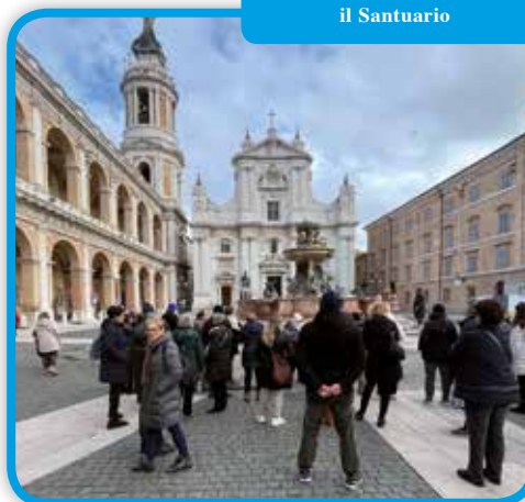
Loreto la Piazza antistante il Santuario