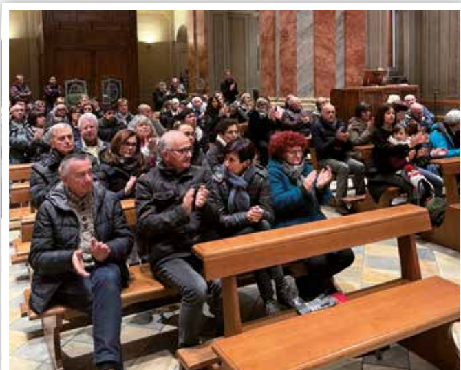
15 dicembre Al concerto un pubblico attento e partecipe