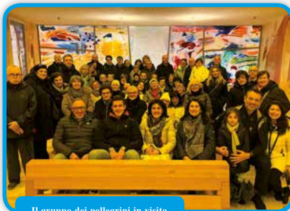
Il gruppo dei pellegrini in visita