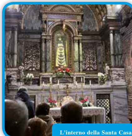
L'interno della Santa Casa