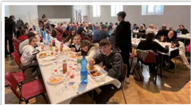
3 dicembre Grande la partecipazione della frazione Cussanio