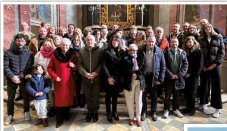
28 gennaio 2024 I Cugini Romana (ci sono anch'io) si ritrovano per ricordare tutti i loro defunti e un momento di festa