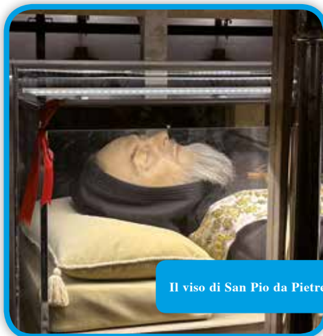
Il viso di San Pio da Pietrelcina