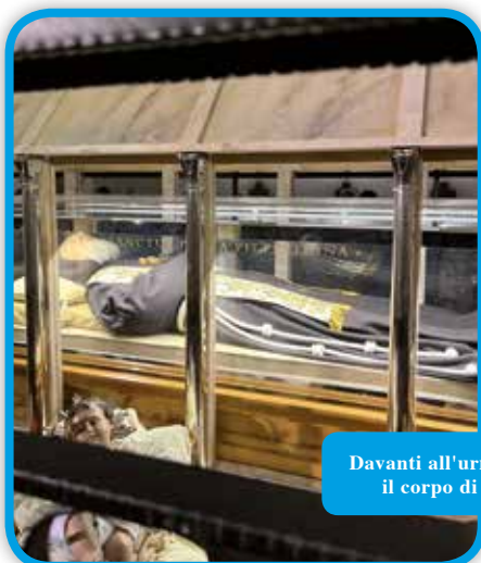
Davanti all'urna contenente il corpo di Padre Pio