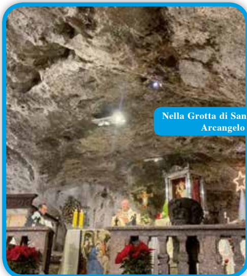
Nella Grotta di San Michele Arcangelo