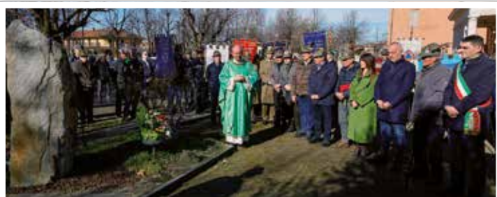
4 febbraio Davanti al cippo che ricorda i caduti in pace e in guerra