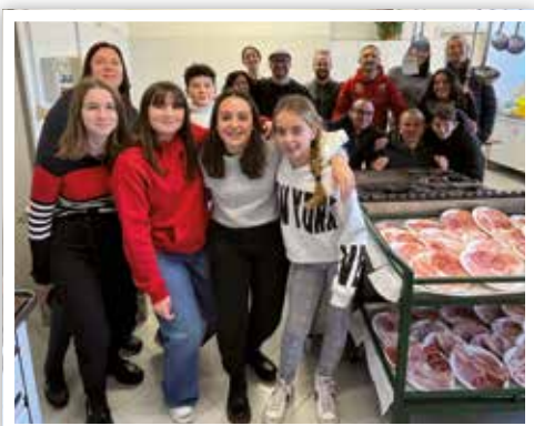
3 dicembre Ecco giovani e brillanti componenti della Proloco e del Consiglio frazionale all'opera per la Polentata