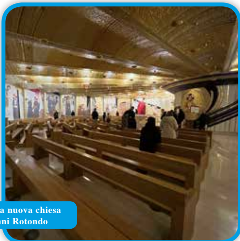
Nella cripta della nuova chiesa a San Giovanni Rotondo