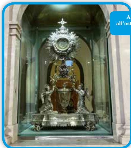
A Lanciano abbiamo pregato davanti all'ostensorio del miracolo eucaristico, l'ostia diventata carne e il vino sangue