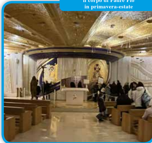
Il luogo dove viene conservato il corpo di Padre Pio in primavera-estate