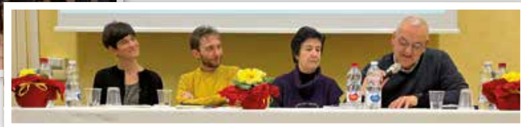
17 febbraio Le coppie di Incontro Matrimoniale hanno festeggiato San Valentino con un incontro di formazione e la festa nei locali del Santuario