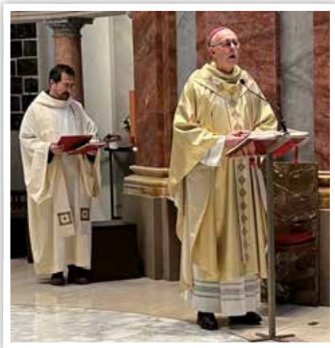
26 novembre SER Mons. Giorgio Lingua Nunzio Apostolico in Croazia presiede l'Eucaristia in Santuario