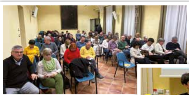
17 febbraio Ecco il salone video con tante coppie qui al lavoro