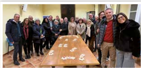
2 dicembre Giornata di formazione per le coppie responsabili di Retrouvaille dell'Italia Nord occidentale