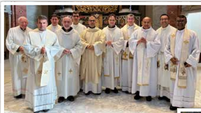
23 novembre 2023 Sacerdoti del vicariato di Levante della diocesi di Ventimiglia-Sanremo

Vi preghiamo di segnalarci errori o dimenticanze