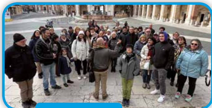
Loreto visita alla Santa casa di Nazareth