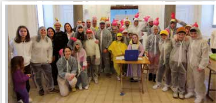
11 febbraio Grande festa di Carnevale con la ProLoco e il Consiglio frazionale e tanta gente